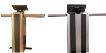
ILS16 & ILS24 Hohenversionen mit der Seitentische

Gleiche Kraft, mehr Raum, mehr Flexibilität, internes 12U 19 Zoll Rack Display optionen darauf unter eingebaut, gesichert, überwacht. Leer geliefert um selbst auszustatten oder Komplettlösung für Hörsaal oder Hotel