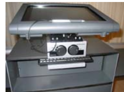
Doppelte Switcher für nahtlose Übergänge